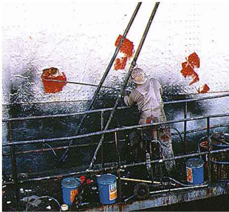
Newport News Shipbuilding

Un navire est défini comme un engin menu d'une voile ou d'un moteur qui flotte sur l'eau ce dernier est soumis à de rudes éléments naturels tels que l'eau de mer, le vent, les vagues et les sédiments marins etc. ... aussi à des manipulations humaines manœuvres portuaires, chargement/déchargement de marchandises en tout sorte ce qui engendre à ce dernier des pannes et arrêts afin d'y remédier le navire doit être entretenu en continu pour limiter c'est anomalie.